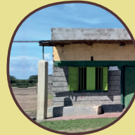
Talek Computer Learning Center